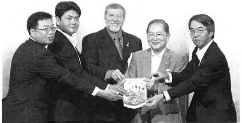
Organization Meeting of the KC of Nagasaki

Moreover, 2 Club Satellites were established in Kyushu division by the leadership of Kumamoto club and Fukuoka club. Thus, while valuing the long history and tradition of Kiwanis clubs in Japan, we have tried hard to be diversified in membership. Kiwanians in Japan are now trying to bring in changes and new ideas to our club activities as well.