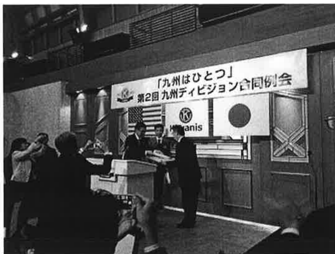
NPO 法人 NGO リサイクル 表彰式 福島 会長